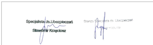
Pieczęć, podpis Ubezpieczyciela